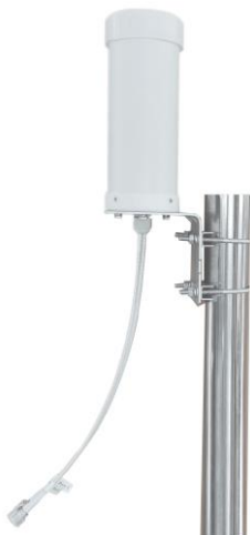
617~960MHz Typical pattern: